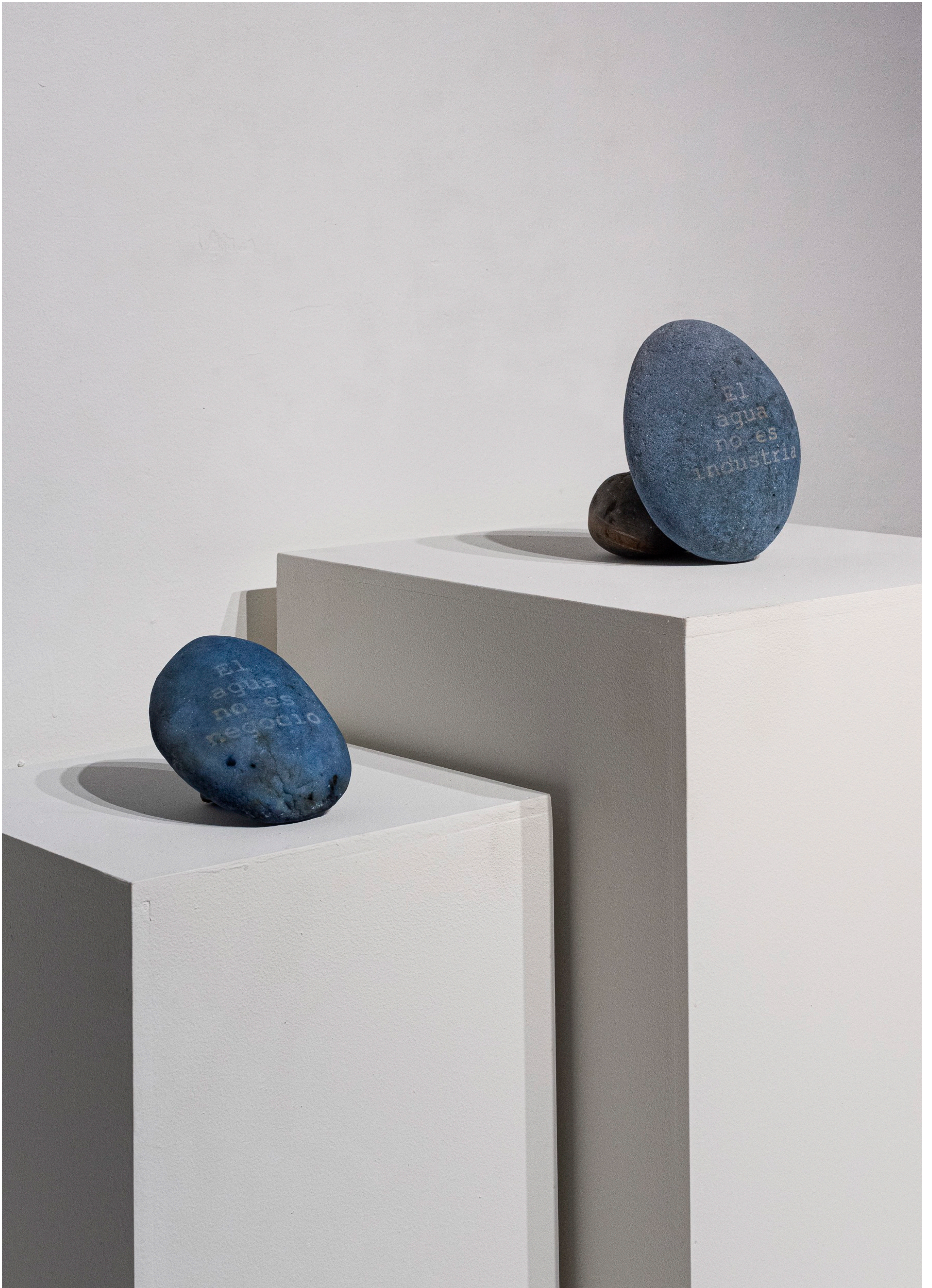
MONTAJE SALA 3